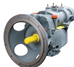
Bride SAE 4