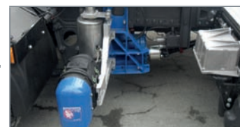
Système étroit non refroidi pour entraînement direct