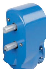
13R - 15L 19R - 22L* Multipliers