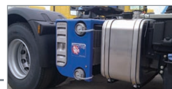
Système refroidi pour entraînement direct