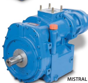
MISTRAL 420 - 750 m 3 /h