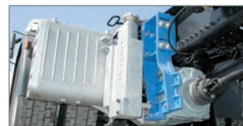
Système non refroidi pour entraînement direct