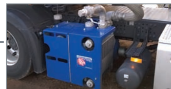
(Aspiration+Pression) Système refroidi pour entraînement direct