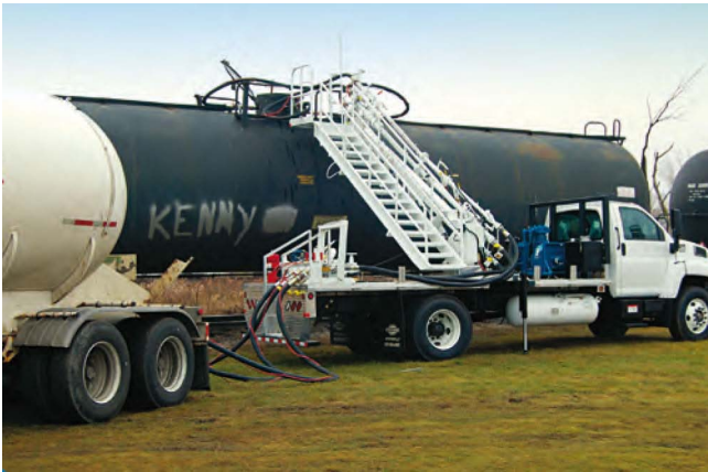
Рис. 2. Использование компрессора Blackmer при перегрузке сжиженного природного газа из железнодорожной цистерны

основное внимание будет уделено соответствующему типу насосов и компрессоров, которые необходимы для перекачки химических веществ, нефтепродуктов, животных жиров, растительных масел и других жидких товаров.