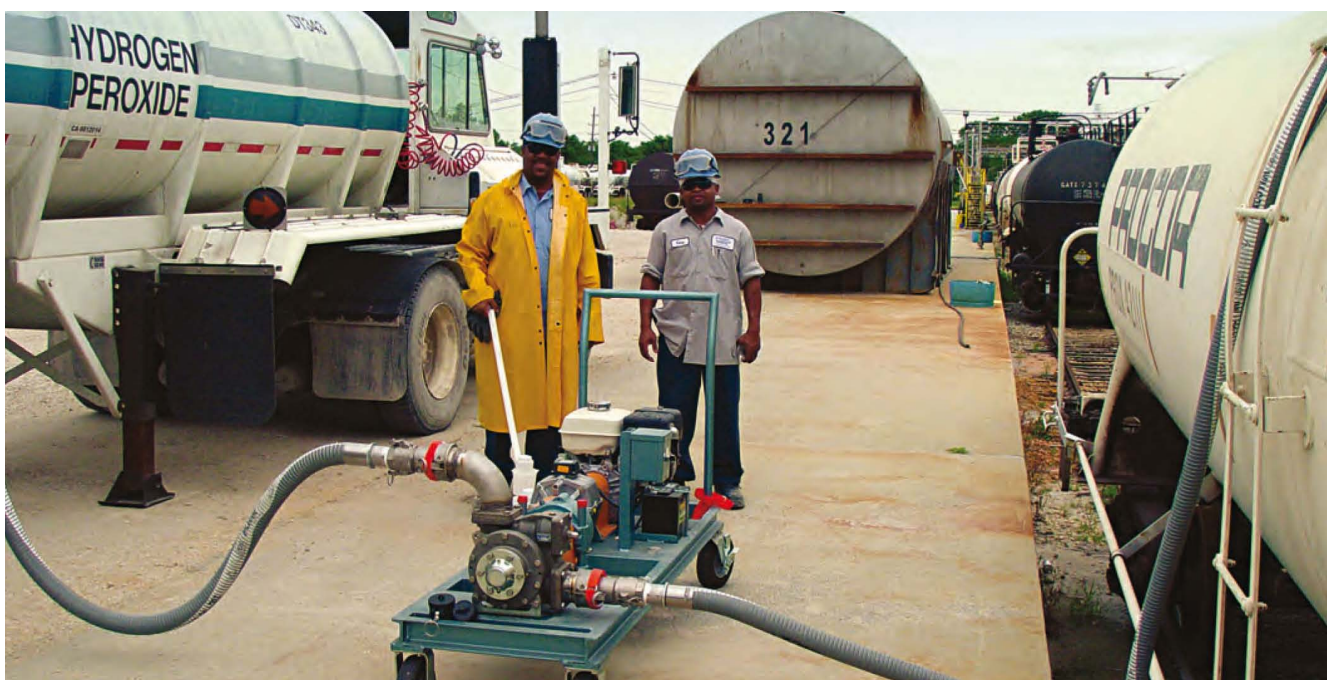
Рис. 1. Операторы складского терминала перевозят шиберный насос на тележке к месту отгрузки

Так как перегрузка связана с определенными требованиями к транспортировке товара на различных этапах цепочки поставок, ей присущи риски порчи или потери дорогостоящего продукта, который, в свою очередь, при разливе также может нанести вред окружающей среде или персоналу. Транспортные средства, используемые в перегрузке, должны быть полностью очищены от продукта, перевозимого в предыдущем рейсе. С учетом всех этих факторов, необходимо использовать в ходе перегрузочного процесса соответствующее оборудование. В статье