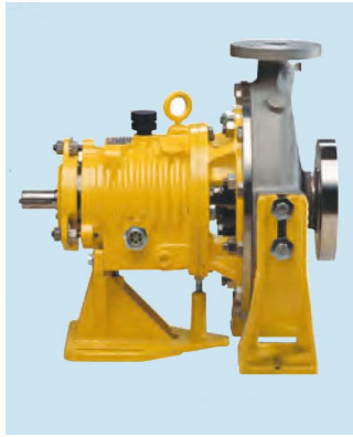
Рис. 5. Центробежный насос Blackmer

Чтобы повысить интенсивность процессов перегрузки, Seeler Industries также использует шиберные насосы Blackmer SX3, установленные на портативных колесных салазках, которые легко перемещаются к месту транспортировки (см. рис.